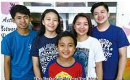
The Cast of the Crane Dog 2018 劇団「あけぼの」2018年来日メンバー

2001年10月2日生まれの16歳、パサイ・ナショナル・サイエンス・ハイスクールの11年生です。理科と幾何学が得意科目で、趣味は料理とダンスです。フィリピン料理ではアドボ、日本料理ではかつ丼が好物です。将来はパイロットになって、家族と一緒に世界中を旅したいと考えています。劇団あけぼのへの参加は2度目ですが、JFCであることを理由にいじめられた経験を活かして、いじめっ子のイメの役などを演じます。この役を演じることで、どうやって難しい状況と向き合ったり、自分自身を守ったりすればいいのかを理解することができるようになりました。今回の来日では、新しい経験をたくさん積んで、自分の大切な人たちのためにも、よりよい人になりたいと思っています。